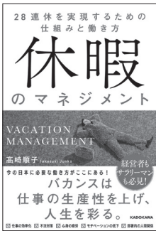
『休暇のマネジメント～28連休を実現するための仕組みと働き方』（KADOKAWA）

今こそ日本に向けて、フランスの労働法制と運用を伝える本をまとめたら、きっと何らかの役に立てるのではないか——その確信から2023年春、『休暇のマネジメント～28連休を実現するための仕組みと働き方』（KADOKAWA、図2）を上梓した。こちらも刊行直後より意思決定層の反響を呼び、2024年夏の全国知事会議では、「休み方改革」のセッションで取り上げられている。